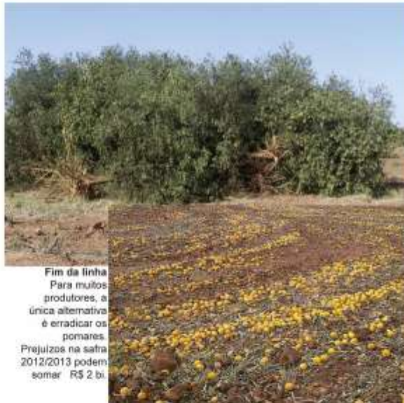
Fim da linha Para muitos produtores, a única alternativa é erradicar os pomares. Prejuízos na safra 2012/2013 podem somar R$ 2 bi.

Crise – Infelizmente os leilões não tiveram início a tempo de impedir grandes perdas no campo. Toda a safra de laranja precoce já está no chão e os prejuízos podem somar R$ 2 bilhões segundo cálculos da Associtrus. (Pág. 3)