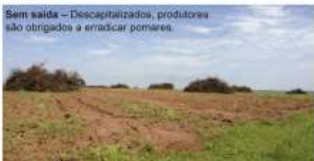
Sem saída – Descapitalizados, produtores são obrigados a erradicar pomares.

da primeira quinzena de novembro de 2012, soma 167,488 toneladas da fruta irrigada e 159,082 ton. não irrigada, sem computar a previsão de queda de 17% em média. (Pág. 4)