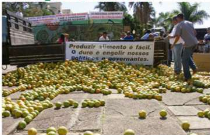
Em Taquaritinga - 12 toneladas de laranja foram distribuídas para a população.

São Paulo responde por 90% da produção do país. (Pág. 3)