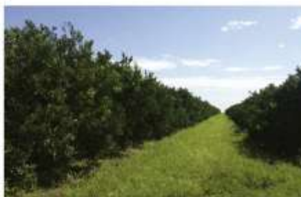
Expansão – Indústrias já detêm 47% da produção do parque citrícola brasileiro.

Para a Associtrus, o governo não pode se limitar a políticas de preço mínimo. Ele tem de controlar, principalmente, a ação do cartel e a verticalização da produção pela indústria. (Pág. 3)