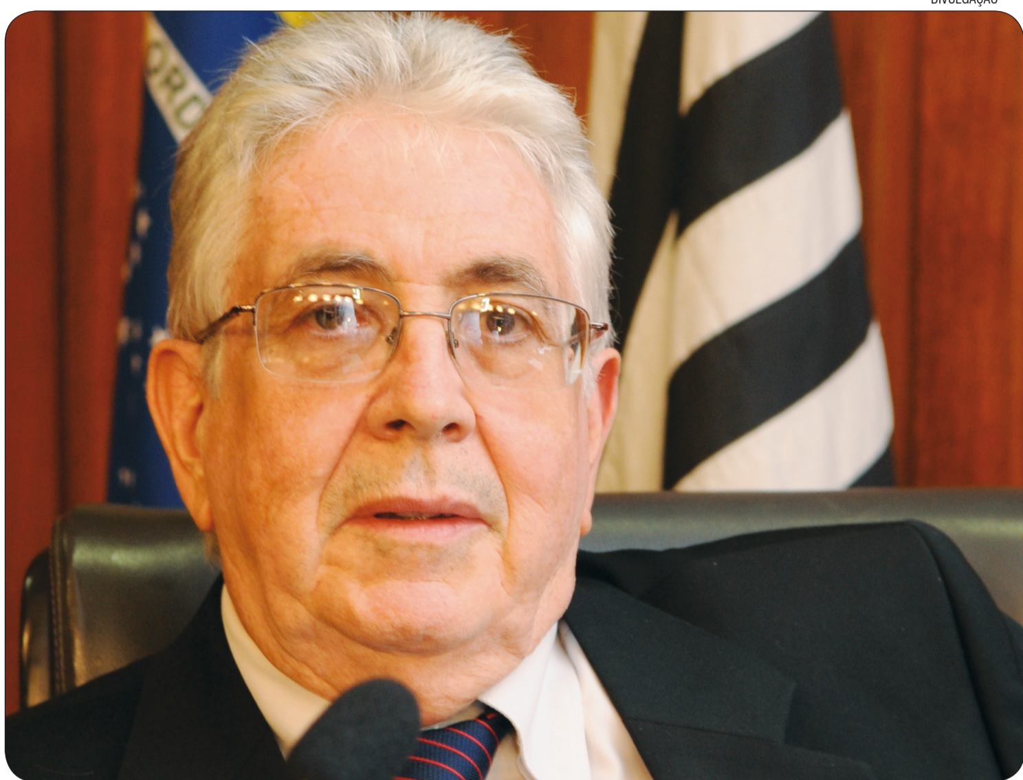
VIEGAS afirma que há mais de 10 anos a Associtrus lutava pela implantação do Consecitrus

“A Faesp pedia a exclusão da Sociedade Rural Brasileira (SRB) e a Unicitrus reivindicava direito a voto. Em fevereiro deste ano, quando o Cade julgou o caso foi determinado que participassem do conselho as seguintes associações: Associtrus, Faesp e SRB representando os produtores e a Citrus-BR pela indústria. As demais entidades terão apenas direito a voz”, finaliza Viegas.