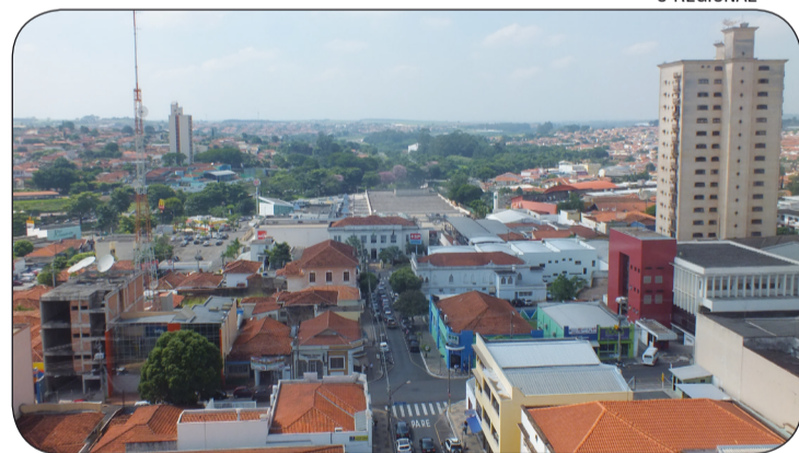
EM CATANDUVA 78 empresas tiveram a inscrição estadual desativada